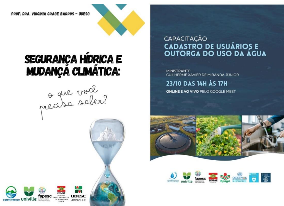
Figura 6 - Cursos de Capacitação Técnica oferecidos pelo Comitê e suas Entidades para seus Membros e a Sociedade

Ambas as iniciativas foram fundamentais para fortalecer os conhecimentos relacionados à gestão de recursos hídricos, consolidando o papel do comitê como promotor ativo de capacitação técnica na área. O alcance total da meta estabelecida ressalta o compromisso e eficácia do comitê em promover a capacitação técnica para uma gestão mais sustentável e eficiente dos recursos hídricos na região.