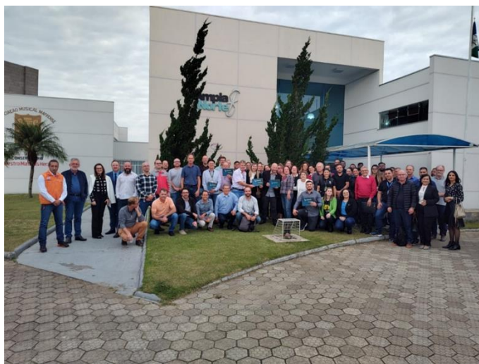
Figura 5 - Membros e demais convidados que estiveram presentes em uma reunião de Assembleia Geral.

AGOs e AGEs tiveram uma participação média de 48% dos membros, superando a meta estabelecida de 45%. Destaca-se o envolvimento expressivo nas AGEs, especialmente naquela que marcou o início do Planejamento Estratégico, onde alcançou-se uma participação de 51% dos membros. É importante ressaltar que, apesar de uma ligeira queda na participação na última AGO, com 43% dos membros presentes, a média geral demonstra um compromisso significativo da equipe em garantir a presença e a participação ativa dos membros nas discussões e decisões do comitê. O comitê reitera seu compromisso em incentivar e valorizar a participação de todos os membros em futuras AGOs e AGEs, buscando uma representação ampla e engajada em prol da proteção dos recursos hídricos e da preservação ambiental.