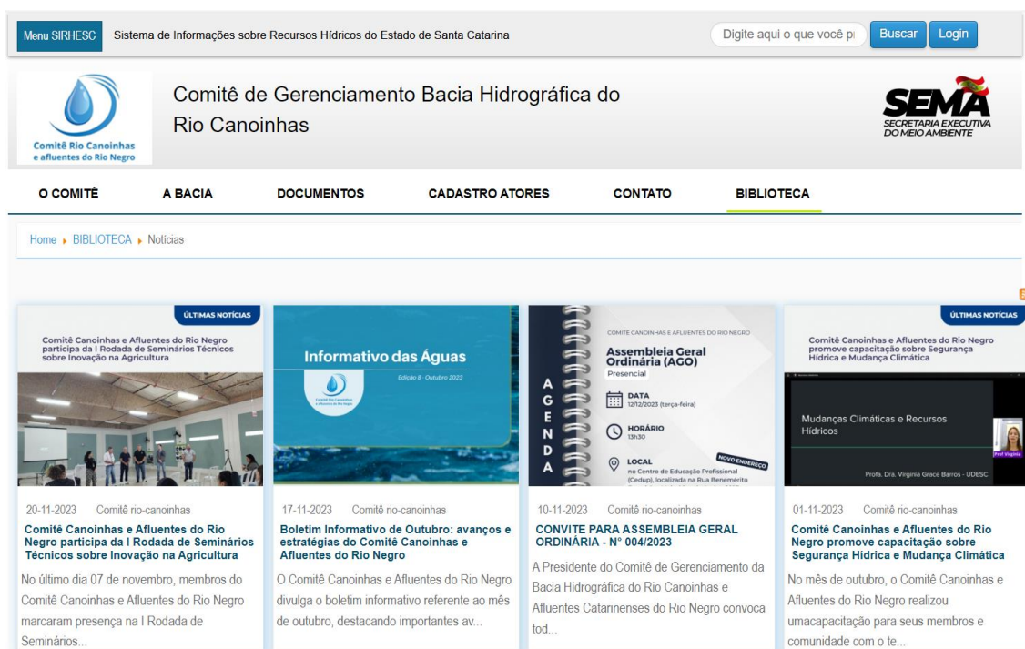
Figura 4 – Amostra do conteúdo publicado no site águas do Comitê.

Cada notícia publicada teve como objetivo informar e inspirar a comunidade, promovendo a conscientização e a participação na preservação dos recursos hídricos e do meio ambiente. Assim, o Comitê alcançou plenamente sua meta de 20 publicações, reforçando seu compromisso com uma sociedade mais sustentável e responsável.