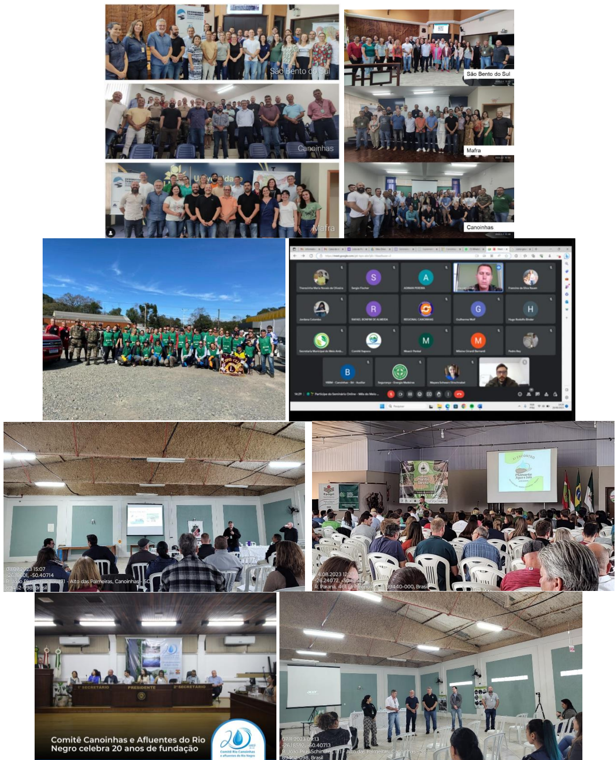
Figura 2 – Membros e demais participantes nos eventos realizados pelo Comitê e suas entidades dos eventos realizados pelo comitê e suas entidades membro.