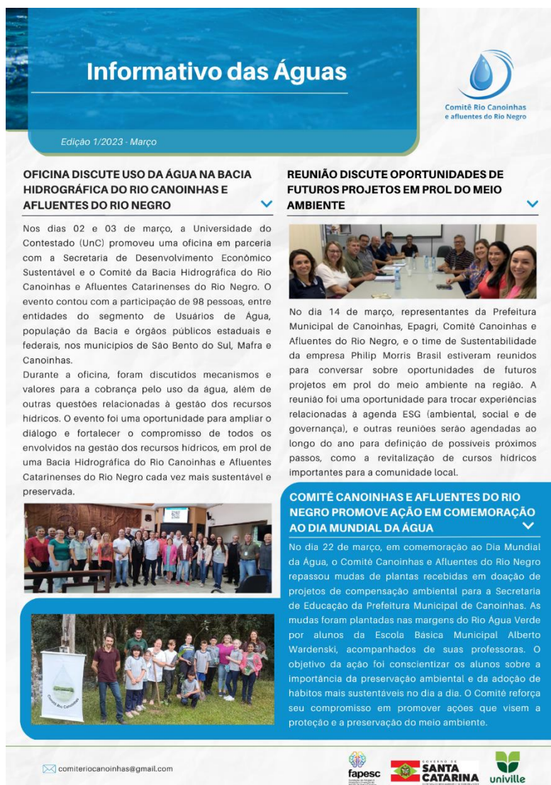
Figura 3 – Exemplo de informativo